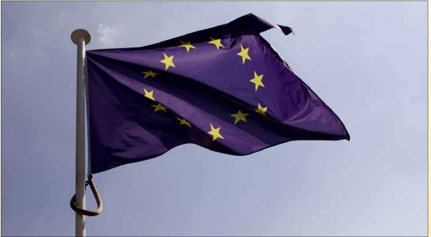
Foto EU-Fahne

Newsletter der Gemeinde Puchenau - GT April 2019